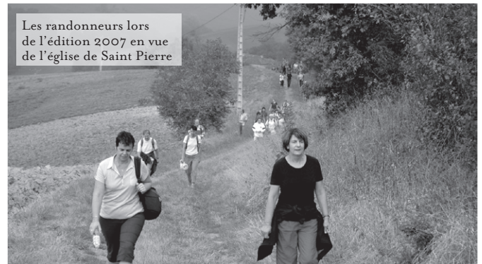
Les randonneurs lors de l'édition 2007 en vue de l'église de Saint Pierre

*Les chiens jaunes sont les personnels de sécurité sur le pont d'envol des porte-avions