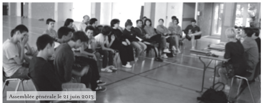
Assemblée générale le 21 juin 2013

Les Cadets/Cadettes. Seulement des entraînements pour les 2 garçons, pas de matches ; les 3 cadettes