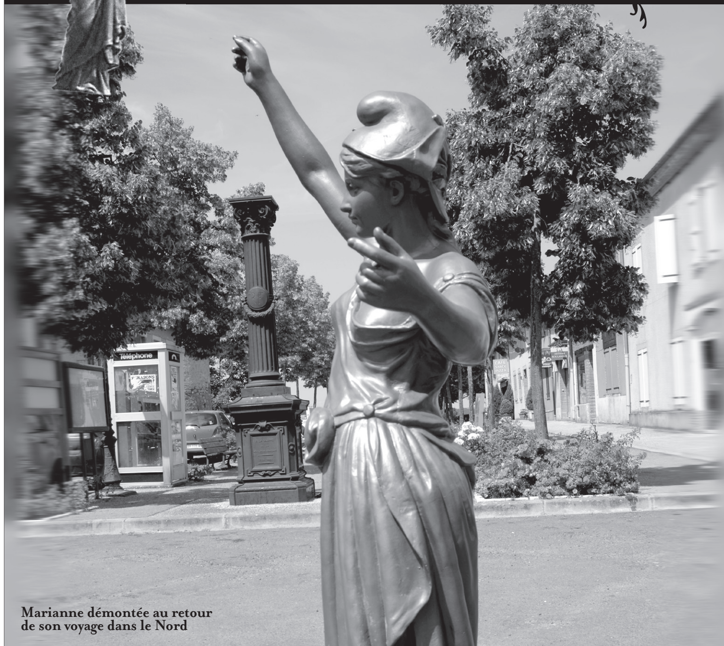
Marianne démontée au retour de son voyage dans le Nord