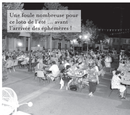
Une foule nombreuse pour ce loto de l'été ... avant l'arrivée des éphémères !

Pour la quatrième année consécutive, le loto du Centre Communal d'Action Sociale organisé par l'Union Associative Salvagnacoise avec l'association des artisans et commerçants et d'autres associations de la commune, se déroulera le lundi 12 août à partir de 20 h 30 sur les