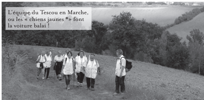
L'équipe du Tescou en Marche, ou les « chiens jaunes * » font la voiture balai !

Pour la 2 e fois à Salvagnac, la «Rando Santé Mutualité» se déroulera le dimanche 6 Octobre. Cette manifestation pédestre ouverte à tout public est organisée en partenariat entre le CDRP 81 (Comité Départemental de Randonnée Pédestre), l'UMT (Union Mutualité Tarnaise) et la Dépêche du Midi. Ces organismes s'appuient sur le club local « le Tescou en Marche » pour l'organisation pratique, en particulier la détermination des sentiers de randonnée et la logistique de la journée. Deux parcours seront proposés : un le matin et un l'après midi.