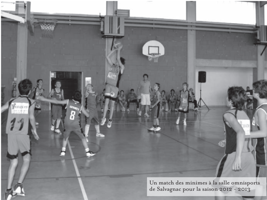
Un match des minimes à la salle omnisports de Salvagnac pour la saison 2012 - 2013

étaient en entente avec St-Sulpice. Equipe Loisirs. Toujours égale à elle-même, dans la bonne ambiance et la bonne humeur, de nouveaux licenciés ont rejoints les rangs de l'équipe fondatrice du Club des Dragons.