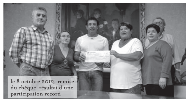
le 8 octobre 2012, remise du chèque résultat d'une participation record