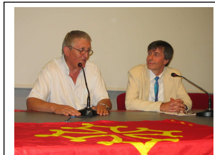
Partenariat ambe Autriche & Pays d'Oc

L'attribution du titre de « Companhon de la beluga d'òc » ( > en savoir plus )