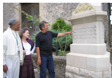
Tarn e Garona occitan : sur le monument aux morts de Bruniquel ( partenariat avec La BIRE - VOX NOVA et mairie de Bruniquel )