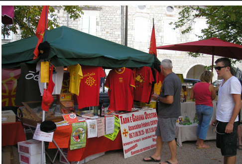
Taulièr abelugat bolegaire