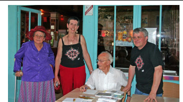
Partenariat avec le COC et le café culturel du commerce à Lauzerte