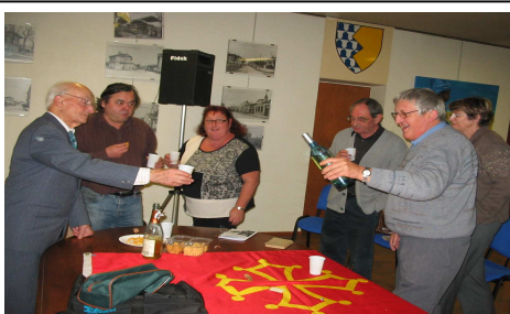
Partenariat avec Cercle culturel de La Ville Dieu du Temple