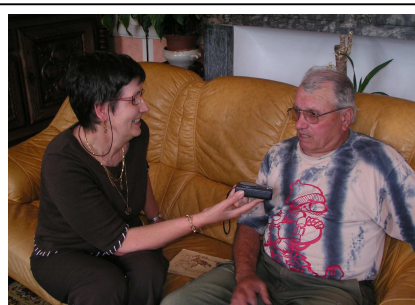
Entrevista ambe lo Catet de Macaturras ...