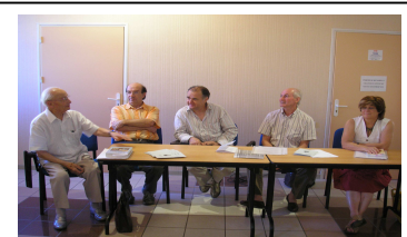
Table ronde pour la commémoration du cinquantième de la mort de Frédéric Cayrou