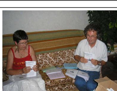
Dans les coulisses de La beluga