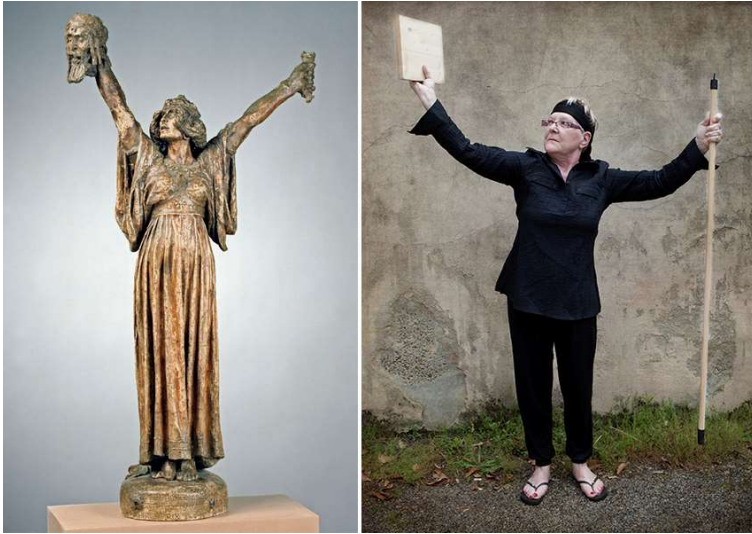
Judith brandissant la tête d'Holopherne / La fierté