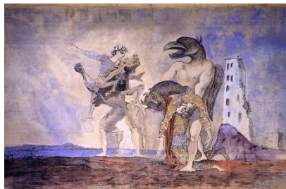
La dépouille du minotaure en costume d'Arlequin