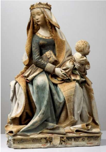
La vierge à l'enfant / Notre Dame du Cameroun, Notre Dame du Maroc, Notre Dame d'Algérie, Notre Dame de France