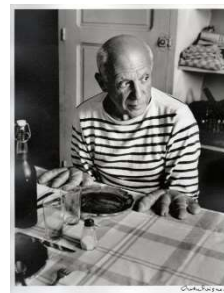
Portrait aux petits pains