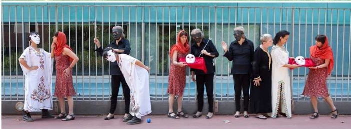
La mort de Saint Jean-Baptiste / Fini la souffrance