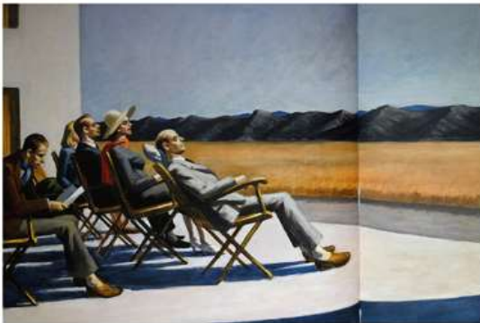
People in the Sun