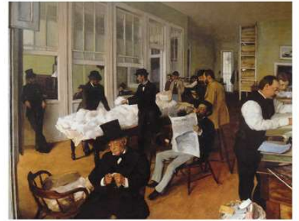
Edgar Degas - l'usine de coton