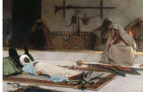
Les Funérailles / Le jour du repos