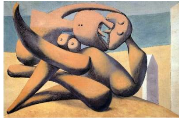
Figures au bord de la mer