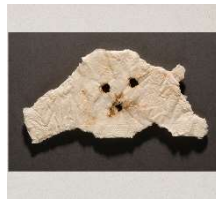
Le rêve et Tête de chien