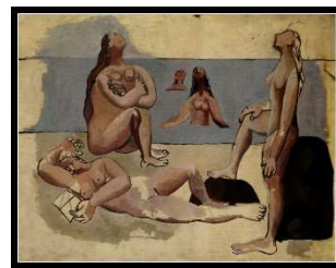
Baigneuses regardant un avion