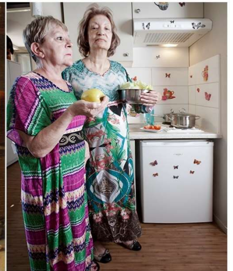
Deux merveilleuses / Deux voisines