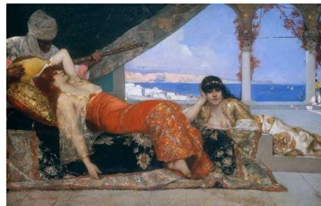
La favorite de l'Emir / Le favori de Toulouse