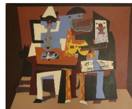
Les 3 musiciens