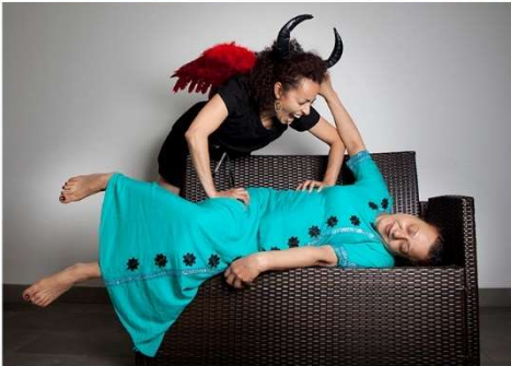
Cauchemar / La mauvaise farce