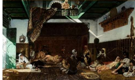
Intérieur de harem / Intérieur de MJC