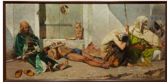
Les prisonniers marocains / Les prisonniers de la bibliothèque