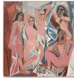
Les demoiselles d'Avignon