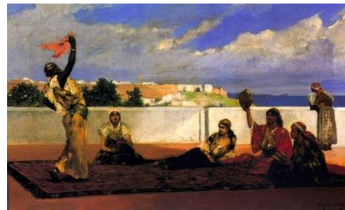
La danse du foulard / La danse gymnique