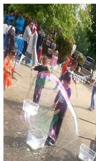
L'Envers du monde