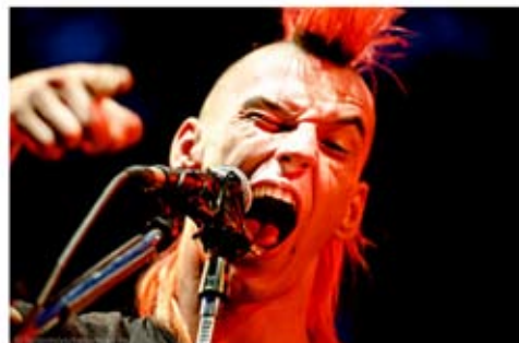
BOB'S NOT DEAD !