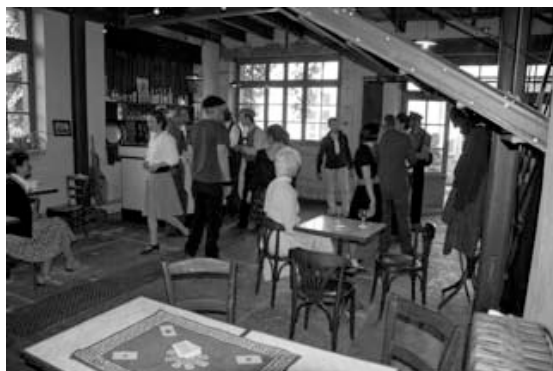
Tournage d'un film à La Cheminée