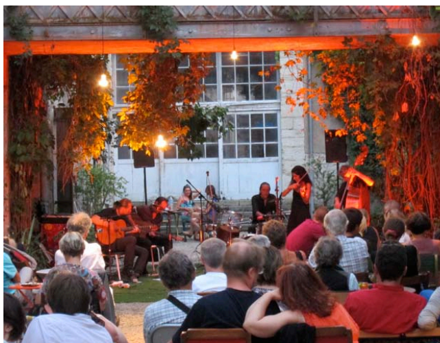
Concert dans la ruelle intérieure