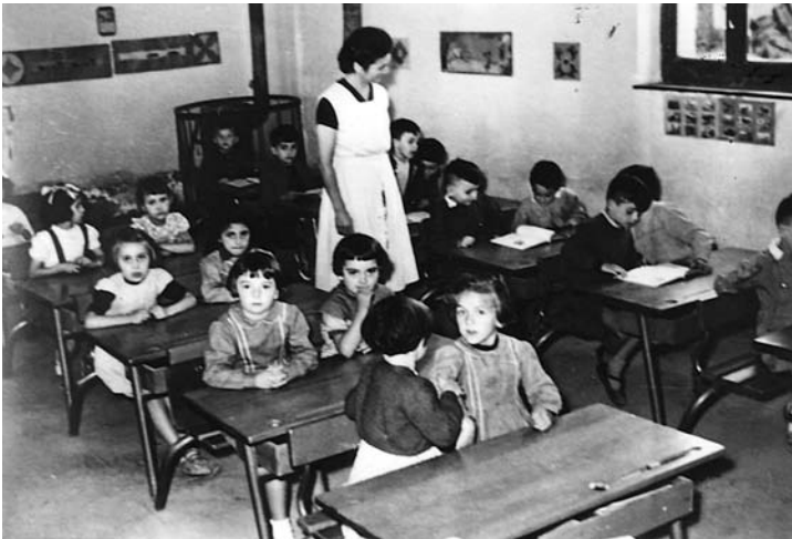
École de Larrazet 1954-1955