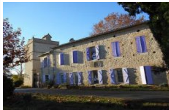
Musée « inVINCible VIGNERon »

Obligation de déclarer en mairie la présence de termites dans les bâtiments.