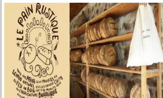
Le Pain Rustique