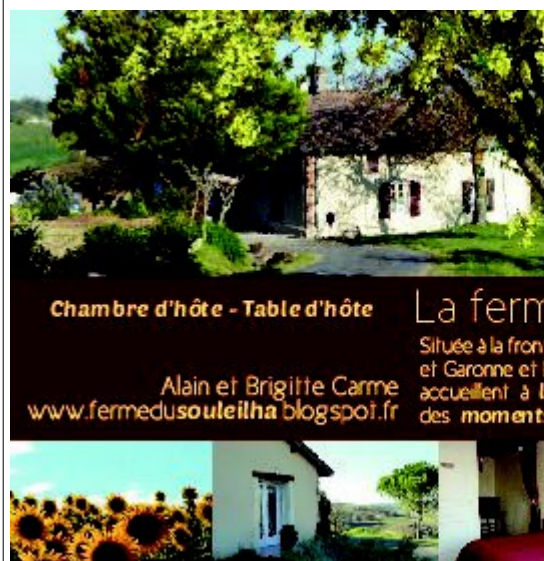
La ferme du Souleilha