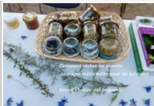
Ô de à soie